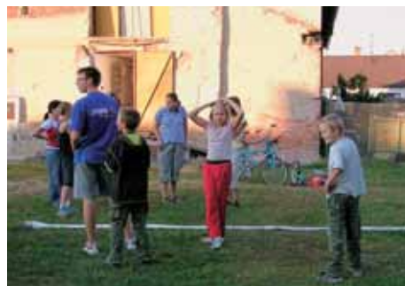
Tato fotografie zachycuje naše Malé Soptíky při tréninku před blížící se soutěží, která se bude konat 14.10.2006 v Dobřejovicích. Tak nám prosím držte pěsti!

Naopak chválíte sběrný dvůr, knihovnu, místní rozhlas a místní loutkaře.