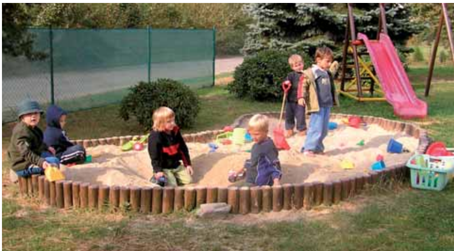
Krásného babího léta si děti z naší MŠ užívaly na zahradě.

Na začátku nového školního roku jsme přivítali nové děti, které se začlenili do kolektivu. Do naší MŠ nastoupilo více dívek než chlapců. V září naší MŠ navštívila společnost Kašpárek s představením Hříbek královský. Program v naší MŠ je rozdělen po týdnech, každý týden má své téma.